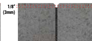
PAVÉS OU PIERRES NATURELLES AVEC CHANFREIN

EXIGENCES DU SABLE POLYMÉRIQUE Largeur minimale des joints: 3 mm (1/8") Largeur maximale des joints: 10 cm (4") Largeur maximale des joints avec base de recouvrement: 5 cm (2") Profondeur minimale des joints: 38 mm (1 1/2")